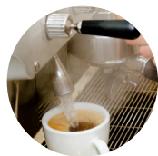
Agua de barra

Botón BYPASS en el panel de instrumentos